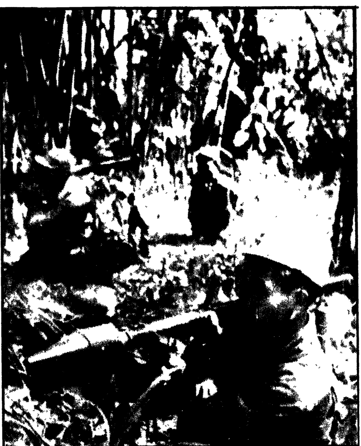
LAOS - Un reparto di partigiani del « Fronte patriottico Lao » si prepara a tendere un'imboscata ai fantocci di Saigon che hanno invaso il paese