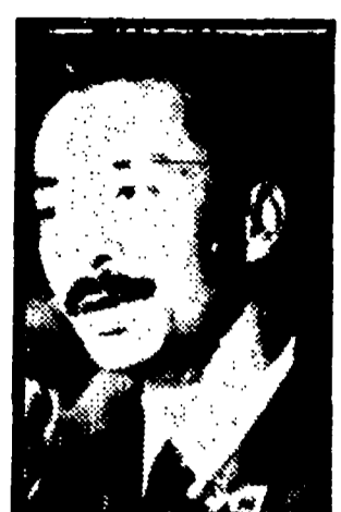
NGUYEN CAO KY. Il prossimo passo