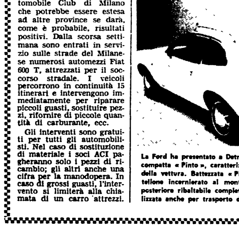
La Ford ha presentato a Detroit questo nuovo modello della sua compatta «Pinto», caratterizzata dalla terza portiera sul retro della vettura. Battezzata «Pinto runabout» l'auto ha lo sportello posteriore ribaltabile completamente, la vettura può essere utilizzata anche per trasporto di cose.

La circolazione dell'aria calda a fredda all'interno dell'abitacolo è garantita da un accurato sistema di ventilazione. Disegnata dagli ingegneri e dagli stilisti della Dodge è sistemata da Ron Mardus della Synthetex Inc. la «Diamante» ha il passo standard della «Challenger», 2,79 m. la lunghezza fuori tutto è di 4,86 m e la sua altezza è di 1,24 m. 5 cm. in meno della «Challenger».