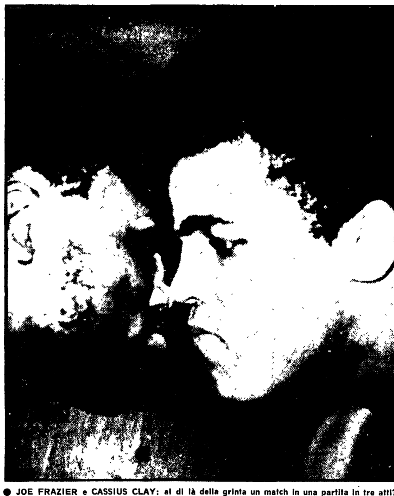
● JOE FRAZIER e CASSIUS CLAY: al di là della grinta un match in una parilla in tre atti?