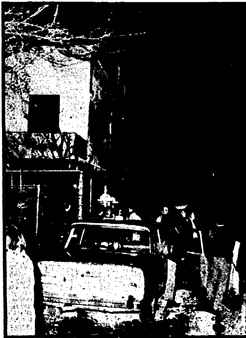
La folla di curiosi davanti alla casa della tragedia e, in alto, la disperazione del padre di una delle vittime.