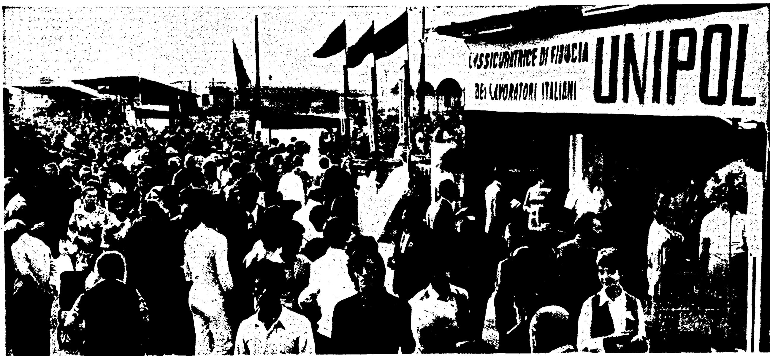
La nostra presenza ai festival della stampa democratica

l'unica compagnia di assicurazioni amministrata dai lavoratori