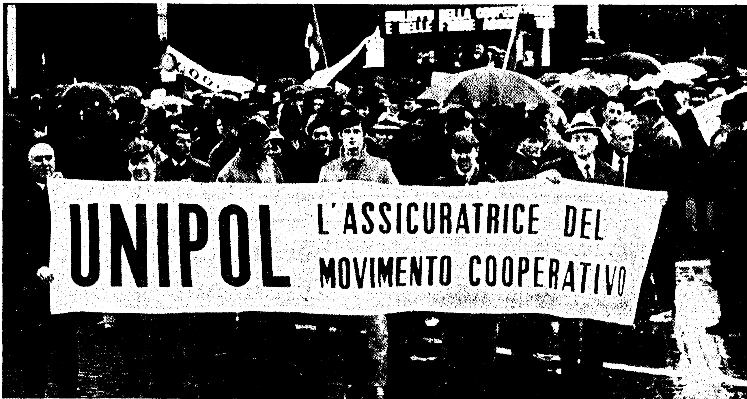
Con i lavoratori per manifestare la nostra piena solidarietà

LAVORATORI! La vostra Compagnia Assicuratrice si chiama