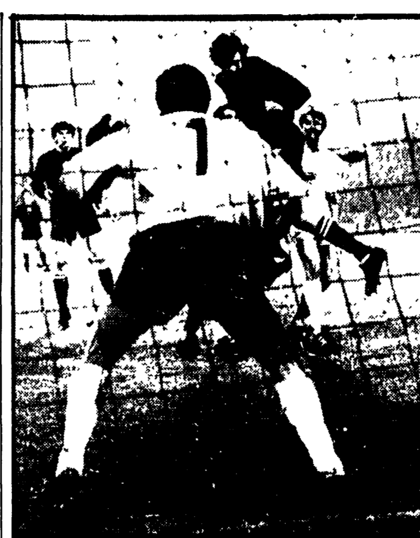
Il Manchester City ha battuto il Gornik di Zabrze per 3-1 (2-0) nella partita di spareggio del quarti di finale della Coppa delle Coppe. Le reti sono state segnate nel primo tempo da Young (Man) e al 38' da Booth (Man); nella ripresa da Lee (Man) e da Lubanski (Gor). Nella semifinale della Coppa delle Coppe il Manchester incontrerà ora il Chelsea (GB) l'altra semifinale opporrà il Real Madrid (Sp) e l'Eindhoven (O). Il Gornik aveva vinto la partita di andata in Polonia per 2-0 ed aveva perso l'incontro di ritorno in Inghilterra per 2-0. NELLA FOTO: una fase della partita.

PARIGI, 31. Una selezione formata da giocatori delle squadre francesi St. Etienne e Olympique ha battuto stasera il Santos di Pelé in un incontro amichevole per 3-1. Le reti sono state segnate tutte con i rigori dopo che i tempi regolamentari si erano conclusi sullo 0-0. Il ricavato dell'incontro è stato devoluto per opere di beneficenza.