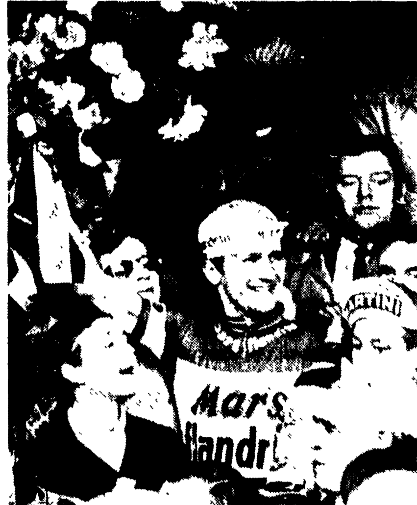
QUENTRUOGE (Belgio) — L'olandese Evert Dolman esultante dopo la vittoria nel Giro delle Fiandre.