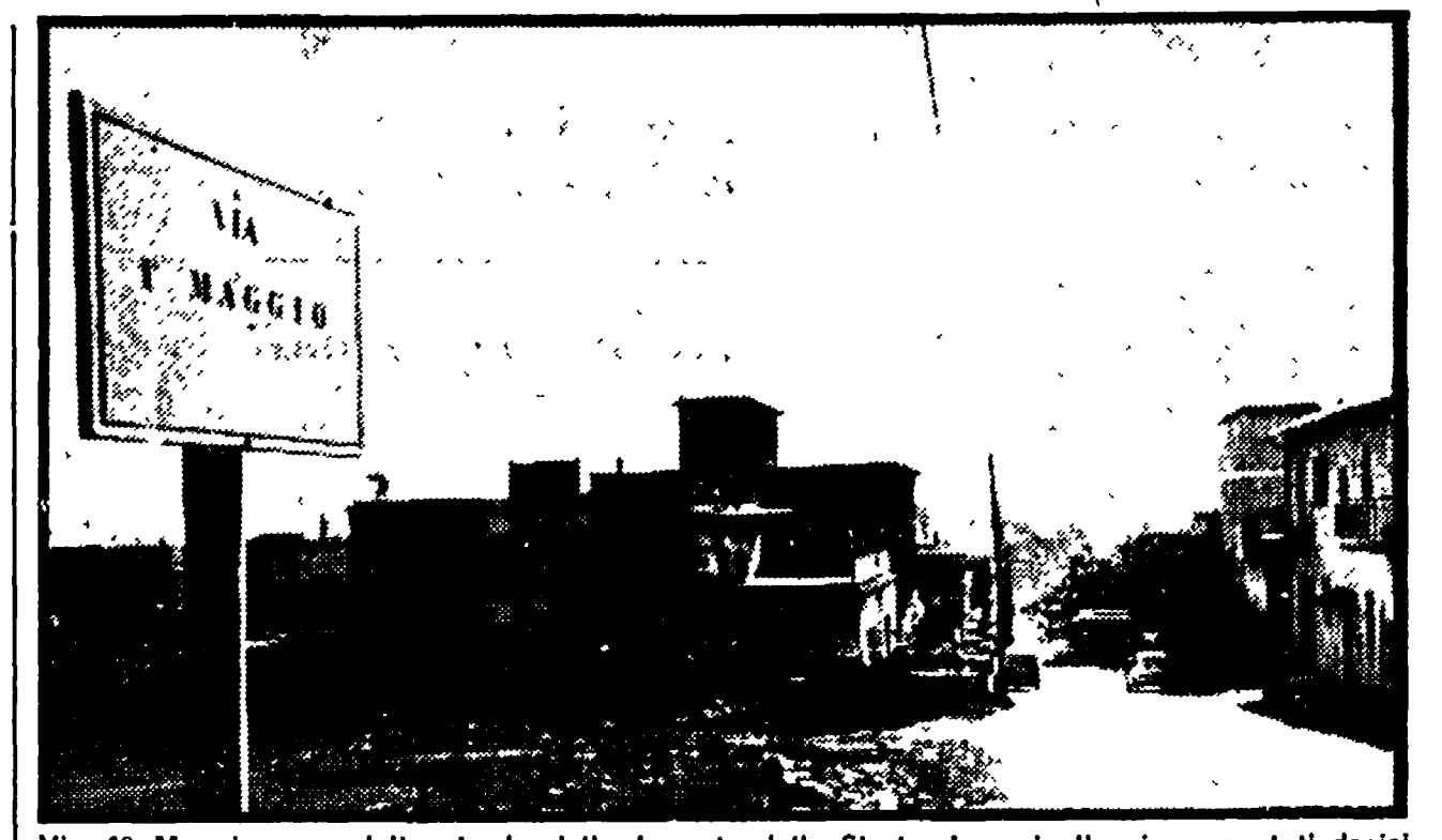
Via 1° Maggio, una delle strade della borgata della Storta. I nomi alle vie sono stati decisi dagli abitanti

Fra i 500 capifamiglia della borgata, i più attivi e coscienti si sono presto resi conto che senza un'azione unitaria e compatta da parte degli abitanti, le autorità comunali avrebbero prestato orecchio da mercante a questo problema per altri anni; e sulla base di un'iniziativa lanciata da alcuni compagni, hanno costituito un Comitato che ha già presentato al capimunicipio le sue prime motivazioni richieste: un contratto urgente e indilazionabile sulla relativa alle fognature; i rifiuti dell'intero agglomerato di Storta, in un modo del tutto primitivo, ad una marrana scoperta, divenuta però veicolo preoccupante di malattie di massa. Fra le prime azioni del Comitato c'è stata quella di ricordare al Comune l'esistenza della borgata con un mezzo inconsueto: sono stati gli abitanti stessi (in massima parte edili) ad innalzare al crocevia le tabelle coi nomi delle « nuove » strade: via I.