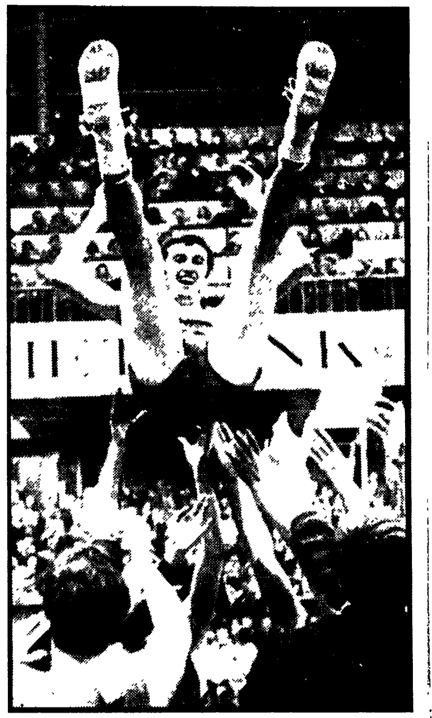
Il capitano dell'Armata Rossa Sergei Belov lanciato in aria in segno di giubilo dai compagni dopo la vittoria sull'Ignis

Un altro tipo di reazione ha avuto invece il Simmenthal mercoledì scorso nella finale per la Coppa delle Coppe che ha vinto riscattando la sconfitta nella spregiata tricolore di sabato a Roma. E cioè la compagine è effettivamente migliorata nel temperamento. Sa reagire, segno che tutti i giocatori sono maturi per esperienze ad alto livello. E