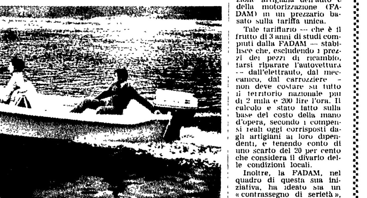
Il «Rio 410» in planata sospinto da un fuoribordo da 33 hp. Si noti che lo scafo viene pilotato a barra, indice questa di stabilità in navigazione, anche con potenze prossime alla massima applicabile.

La tecnica costruttiva ha consentito di mantenere un prezzo concorrenziale per un motoscafo fuoribordo sino a 40 HP.