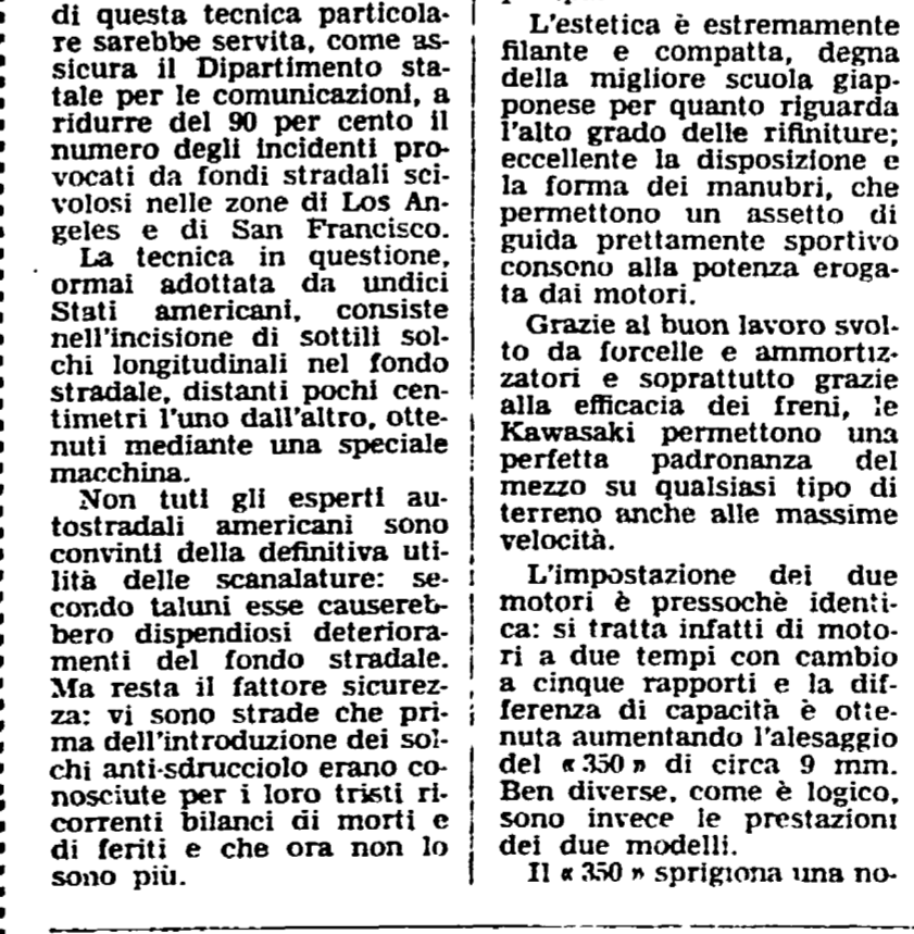
La Kawasaki Avenger 350: può raggiungere i 169 chilometri orari.

Dal Giappone tre belle bicilindriche prodotte dalla Kawasaki e dalla Honda. Prestazioni molto elevate, rispetto alla cilindrata - Estetica di ottima scuola, specie per i primi due modelli - I loro prezzi e i loro consumi.