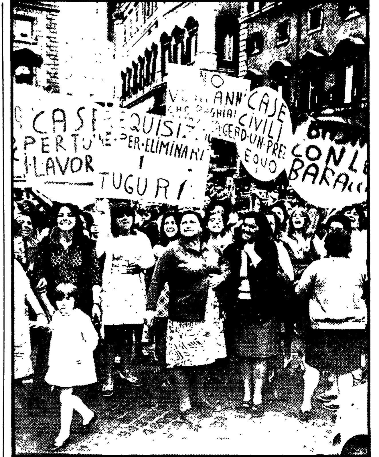
Un momento della manifestazione tenuta ieri davanti a Palazzo Chigi da oltre un migliaio di baraccati