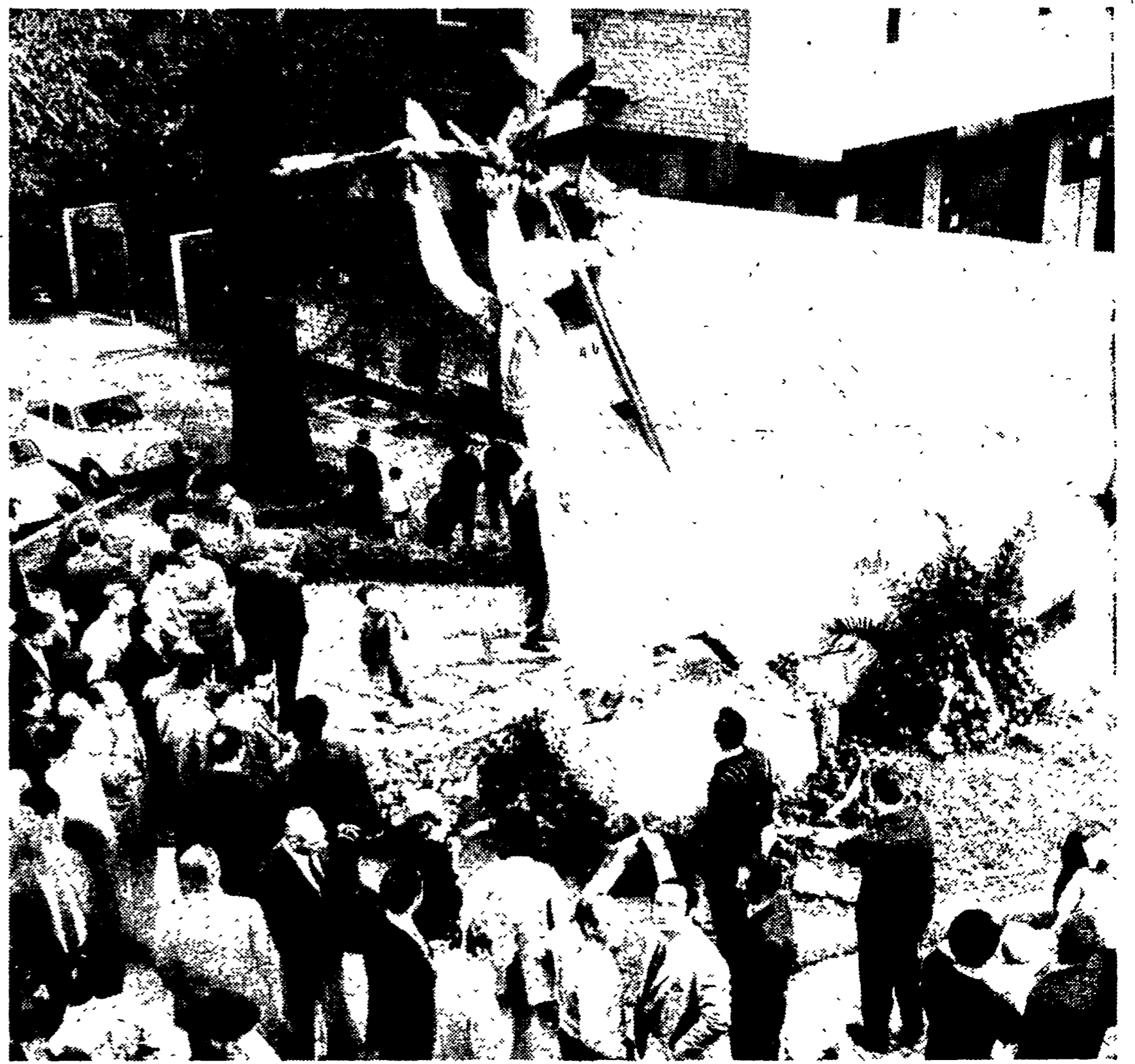
MILANO — Il monumento alla Resistenza, nella piazza del comune di Sesto San Giovanni (nella foto), colpito dall'attentato fascista, è stato meta ieri di migliaia di cittadini, compagni, antifascisti.

La situazione politica a La Spezia, infatti, si è improvvisamente deteriorata a causa dello spostamento a destra della DC, spostamento a destra che si è espresso nell'esplosione dei contrasti per la attribuzione delle presidenze dei maggiori enti economici cittadini che sono state assegnate a squalificati esponenti della destra democristiana. I giovani democristiani, a questo riguardo, parlano della politica del loro partito, come di una « politica qualunque » oggettivamente di destra.