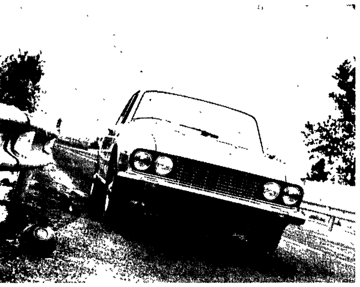
Il coupé Lancia «2000» si distingue esternamente dal coupé «Flavia» soprattutto per il frontale di nuovo disegno. Le modifiche maggiori sono state apportate alla parte meccanica.

Non è escluso che, dopo il rilancio delle vetture di due litri, la Lancia rimetta in listino una vettura da tre litri per coprire il vuoto lasciato dalla «Flaminia».