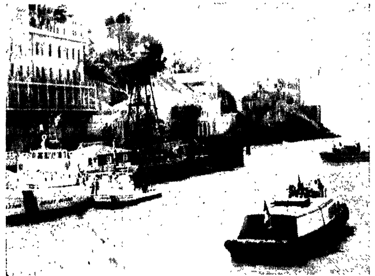
SAN FRANCISCO — La polizia americana ha invaso l'isola di Alcatraz (nella foto), nella baia di San Francisco, per espellere quindici indiani (sei uomini, quattro donne e cinque bambini) che l'occupavano da diciannove mesi. Alcatraz era stata sede di un penitenziario, chiuso nel 1963 dopo ventinove anni di servizio. Alla fine del 1969 un centinaio di indiani occupavano dimostratamente l'isola, in segno di protesta contro il maltrattamento della minoranza indiana da parte del governo americano. In questi ultimi tempi la colonia degli occupanti si è ridotta ai quindici esposti ieri. Il loro avvocato ha accusato il governo di Washington di avere deliberatamente ingannato gli occupanti, intorolandosi con essi conversazioni per risolvere la vicenda. «Il risultato finale — ha detto l'avvocato — è stato il tradimento».