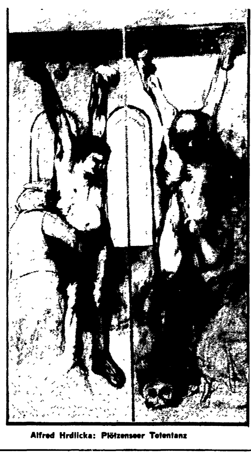
Alfred Hrdlicka: Pflanzener Tolenz