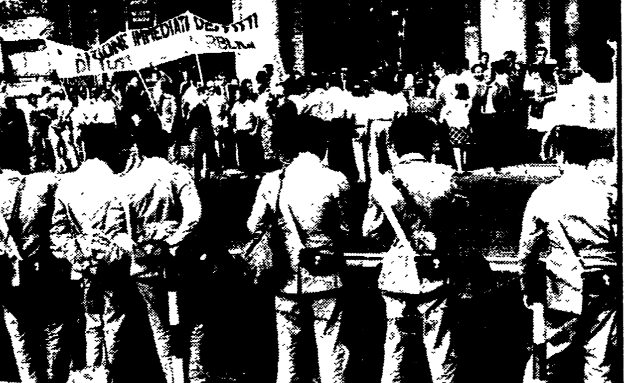
Un momento della manifestazione di inquilini in piazza Colonna

Calci e pugni per cacciare da piazza Colonna i rappresentanti di ventimila famiglie che vogliono la decurtazione dei fitti - Una delegazione non trova con chi conferire - Mutamento di indirizzo della presidenza del Consiglio? - Cresce a Valmelaina il movimento per la casa