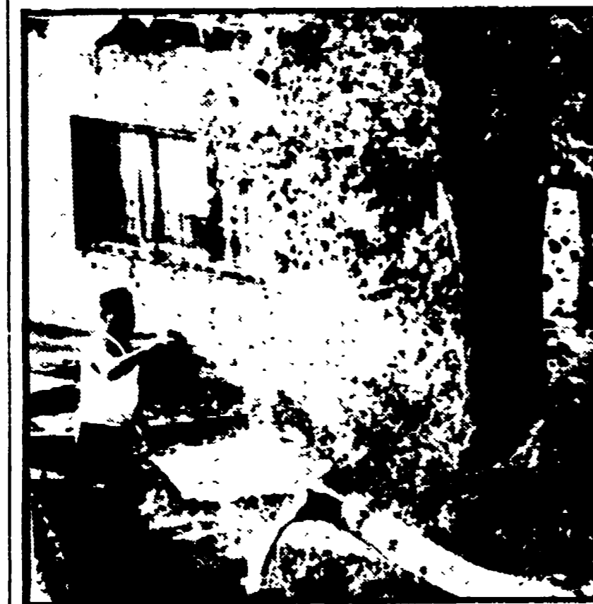
VENEZIA - Alberi sradicati dal violento temporale colpiscono una casa provocando gravi danni

Nubifragi a Padova, Venezia, Firenze e Bologna - Morti e feriti in Francia, maltempo a Budapest - Le previsioni di fine luglio