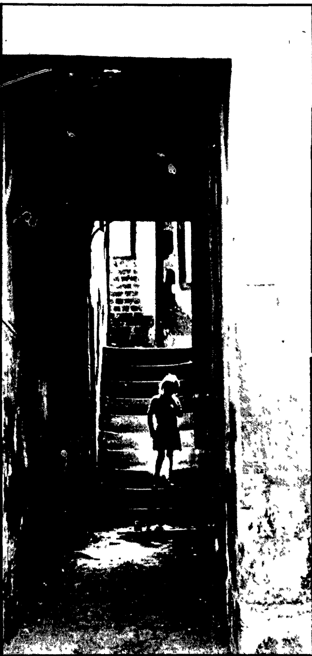
GLASGOW — I tuguri del quartiere Gorbals

I primati di questa regione: paghe più basse, disoccupazione più alta, sussidi assistenziali più diffusi che in tutto il resto d'Inghilterra - 10 per cento di disoccupati: 150 mila posti di lavoro sono venuti a mancare - Decine di migliaia di emigrati all'anno - Consapevole risposta operaia