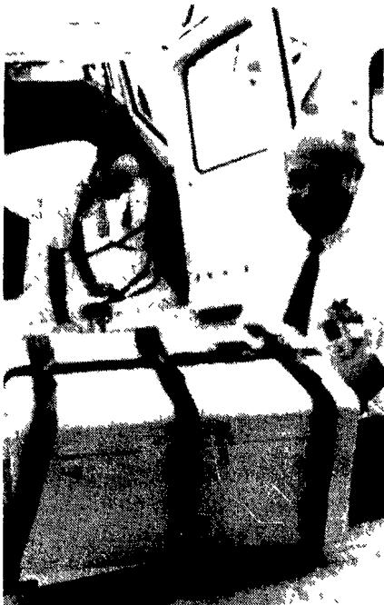
HOUSTON — Mentre i tre astronauti americani reduci dall'ultima impresa spaziale di Apollo 15 navigano felici verso casa a bordo della imbarcazione americana Okinawa i tecnici del centro spaziale hanno già provveduto a trasportare le preziose rocce lunari, al sicuro nella «scagnola» nei laboratori per essere sottoposte ad una lunga serie di esami