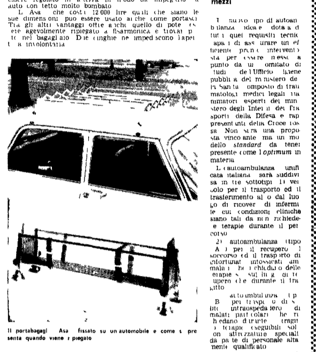
Il portabagagli Asa fissato su un'automobile e come si presenta quando viene piegato.

Gli accessori per le automobili sono tutti pratici e utili. In molte occasioni si può dire che un accessorio è utile se è comodo e comodo se è utile. Un accessorio che non è utile e comodo è inutile. Un accessorio che è utile e comodo è utile e comodo. Un accessorio che è utile e comodo è utile e comodo. Un accessorio che è utile e comodo è utile e comodo.