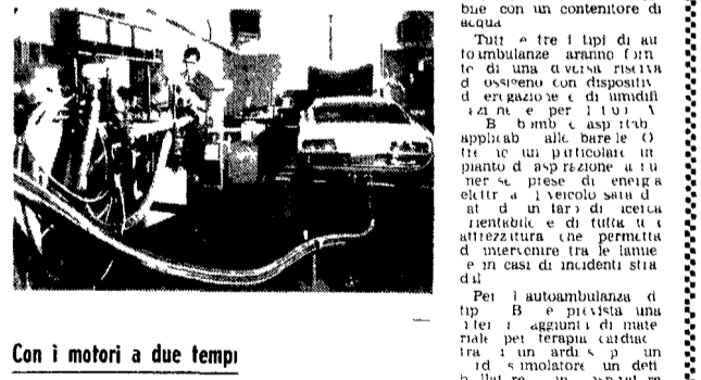
Con i motori a due tempi

Dopo le prime norme anti inquinamento atmosferico emanate nel 1963 negli Stati Uniti, i paesi europei volendo giungere sulla stessa materia ad una normativa comune che possa essere applicata all'ottimo.