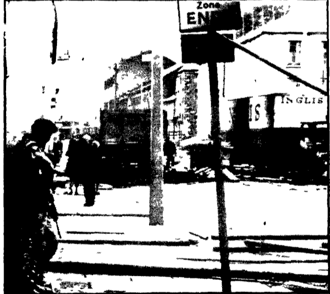
BELFAST — Un aspetto desolato della città dopo i violenti disordini e le stragi. Un soldato inglese di guardia nei pressi di una panetteria, nella zona del mercato di Belfast

I morti sono ormai ventidue - Nove ore di sparatoria nei pressi di Eliza Street - Un panificio occupato da un «comando» dell'IRA - Immensi i danni all'economia della regione - L'assurdità della «linea dura» adottata da Londra - L'ex direttore del «New Statesman» paragona la situazione irlandese alle repressioni imperialistiche classiche - Fischiate a Londra il ministro degli Esteri dell'Eire - Drammi quasi tremila i profughi