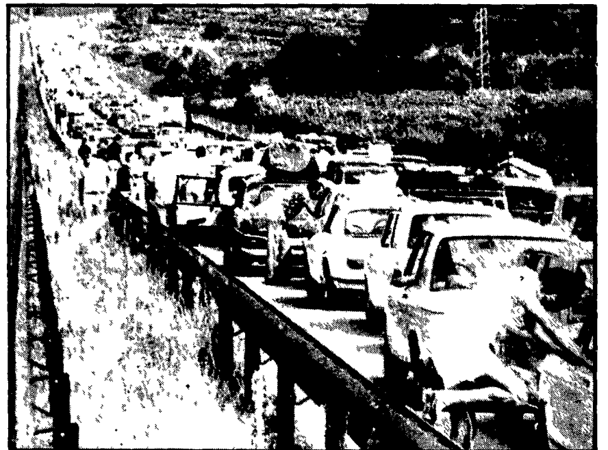
Tutto ciò che, su quattro ruote, era rimasto nelle città dopo l'inizio del grande esodo d'agosto (ai primi del mese) sembra essersi messo in movimento. Tra ieri e la mattina di oggi, in particolare sulle strade «locali», il traffico ha toccato in ogni parte d'Italia punte altissime e, spesso, caotiche come dimostra la foto scattata al casello autostradale della Milano Venezia.