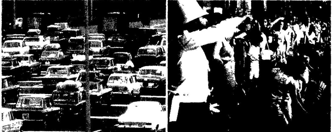
Intenso ma scorrevole il traffico di ieri su autostrade e strade statali e provinciali su tutta la Penisola. Il secondo giorno del ferie si è svolto in modo ordinato, quale si spera con la riapertura delle fabbriche. Il traffico è stato intenso ma scorrevole.

Gli automobilisti hanno accettato il consiglio di viaggiare di notte e di evitare le autostrade