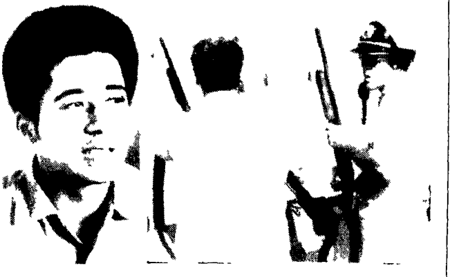
NELLE FOTO — Il negro George Jackson a destra bloccato per essere aggredito da un poliziotto (A PAGINA 5)

Sei morti in una tragedia alla cui origine è forse una provocazione poliziesca ■ Il giovane, autore di una raccolta di forti lettere dal carcere, era diventato uno dei portabandiera della lotta contro il razzismo