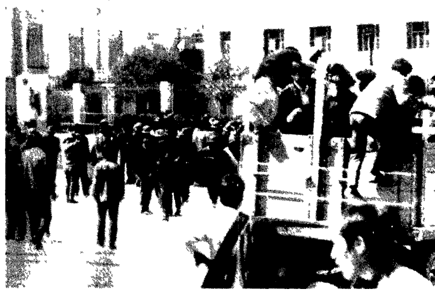
LA PAZ — Studenti e lavoratori si riuniscono nei pressi del quartier generale delle forze armate ribelli per manifestare la propria fedeltà al governo del Presidente Torres

LA PAZ. Il generale Torres è stato deposto dal colpo di Stato che ha preso il potere il colonnello Hugo Banzer. Il generale Torres è stato deposto dal colpo di Stato che ha preso il potere il colonnello Hugo Banzer. Il generale Torres è stato deposto dal colpo di Stato che ha preso il potere il colonnello Hugo Banzer.