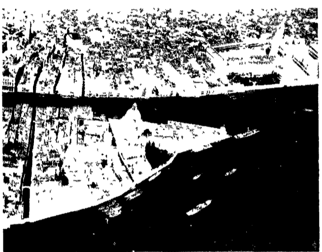
VENEZIA — Le petroliere e i trasporti navali pesanti non attraverseranno più il centro di Venezia. Il diramamento delle grandi navi per il canale di Malamocco costituisce così un primo passo per la salvaguardia della laguna.

rica può sempre incendiarsi una «cisterna» gonfia di gas può sempre esplodere. Per anni e anni da quando le torri di distillazione e le incastrature metalliche degli stabilimenti petrolchimici sono diventati il contrappunto tecnologico dei merletti bizantini dei palazzi e del barocco rigonfiato della Venezia ha vissuto sotto la minaccia di un simile pericolo.