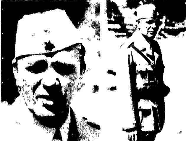
BELGRADO — Ecco le prime immagini di Richard Burton ritratto nei panni del maresciallo Tito ai tempi della gloriosa resistenza del popolo jugoslavo al nazifascismo. Come è noto il celebre attore è il protagonista del nuovo film «Sutjeska» diretto dal regista Stipe Delic e attualmente in lavorazione tra le montagne del Montenegro.