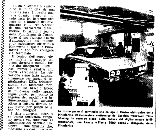
In primo piano il terminale che collega il Centro elettronico della Pininfarina all'elaboratore elettronico del Servizio Honeywell Time Sharing. In secondo piano sulla pedana del digitalizzatore tridimensionale, una Lancia «Flavia 2000 coupé» disegnata dalla Pininfarina

L'inchiesta deve individuare le relazioni tra le lesioni riportate e i danni ai veicoli