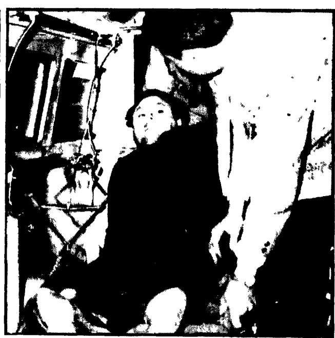
Liggio al momento dell'arresto nel 1964 dopo 16 anni di latitanza