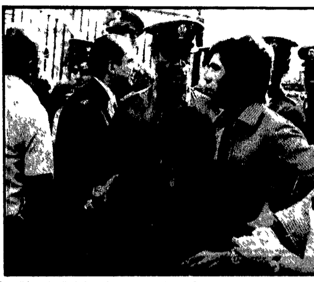
La polizia carica il picchetto davanti ai cancelli della Romanazzi

ROMA SED presso la sede ne Torpignattara alle ore 17 riunione di segreteria allargata al gruppo lavoro scuola.