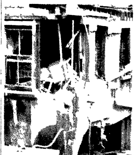
Mentre continua la serie di attentati nelle città dell'Ulster si inasprisce la polemica fra il governo britannico e quello irlandese...

Sciopero alla Pirelli di Milano contro le rappresaglie (A PAGINA 4)