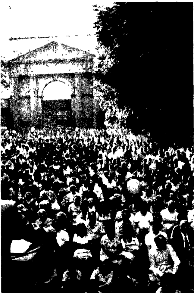
Anche ieri in tutta Italia si sono svolte migliaia di feste dell'Unità contrassegnate ovunque da una grande partecipazione popolare.