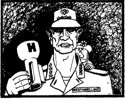
Il generale Westmoreland visto da Gal

Oggi è ospite del governo italiano: ricordiamo quante Song My ha sulla coscienza Napalm, fosforo, bombe a biglia in un crescendo che però non gli ha dato la vittoria - « Odio i vietcong » - Con arte personale, ha tradotto la violenza del sistema USA