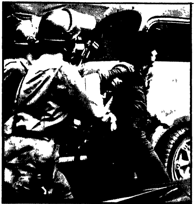
Un giovane caricato dalla polizia durante la protesta contro Westmoreland a piazza Colonna

Brutale carica della polizia contro i dimostranti - Otto fermati e uno arrestato - Un comunicato della Federazione giovanile comunista romana - Domani iniziative di propaganda in tutti i quartieri romani