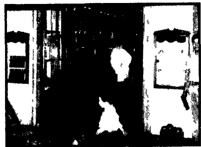
La vetrina della gioielleria svaligiata