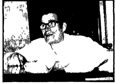
Il gioielliere che non si è accorto di niente