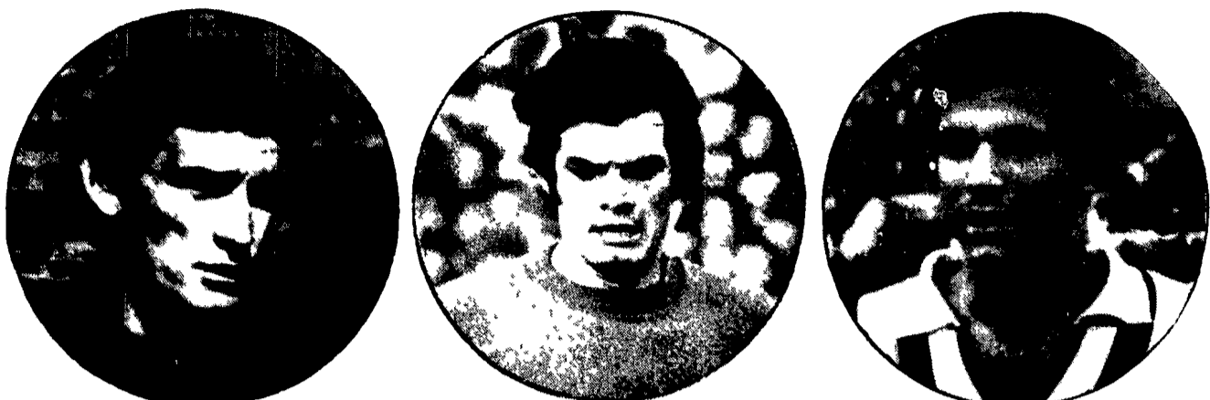
Il rientro di GIGI RIVA in nazionale è la più gradita novità di Italia-Messico