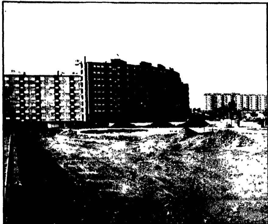
Ecco il quartiere di Spin cato Doveva essere il quartiere modello della Legge 167, ma ancora il Comune non è riuscito a realizzare completamente le opere di urbanizzazione. Devono essere ancora costruiti alloggi e realizzate opere per circa 20 miliardi.

Le responsabilità delle giunte comunali e di Palazzo Valentini - I piani di zona della 167 - Gli esempi del Casilino e del Tiburtino - 99 progetti di edifici scolastici fermi al provveditorato opere pubbliche - Quando si costruiranno gli ospedali?