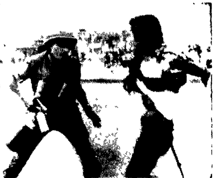
SAIGON - Un ex ufficiale dell'esercito di Saigon mutilato di guerra alle prese con un pallottolo durante la manifestazione contro Van Thieu e la guerra americana sull'autostrada tra Saigon e la base di Bien Hoa.

SAIGON 26 settembre. Le forze di liberazione sud vietnamite hanno dato una pronta risposta all'intensificarsi della offensiva aerea americana dopo l'attacco ai campi di aviazione del Nord e al territorio stesso del Vietnam del Sud nel le ultime quarantotto ore decine di posizioni delle truppe di Saigon e delle truppe americane sono state sottoposte ad attacchi con morti ed i feriti. In vari casi ad attacchi diretti con reparti di terra. Gli attacchi si sono verificati praticamente su tutta l'estensione del territorio sud vietnamita lungo la frontiera cambogiana sugli alti piani centrali e attorno alla grande base americana di Bien Hoa a ventiquattro chilometri a nord di Saigon.