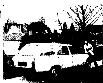
La versione «Familiare» della Peugeot «504»

Questi veicoli da turismo e da lavoro rappresentano il 30 per cento della produzione della Casa della «404» non saranno più importati i modelli per uso promiscuo.