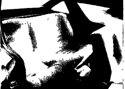
L'accoglientissimo abitacolo della Renault «17 TL». Questo modello costerà in Francia 2.223.000 lire.

Quando si dice buone strutture si riferisce però al numero degli strumenti che la loro collocazione se ne consente una rapida lettura nelle ore notturne.