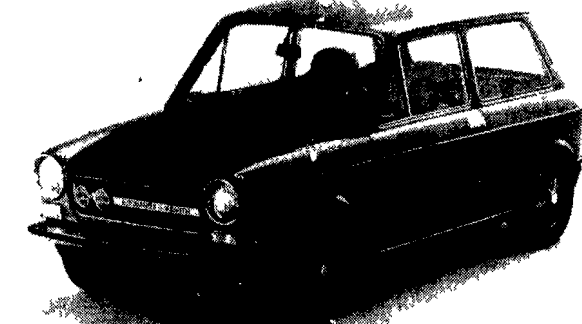
La nuova «A 112», frutto della diretta collaborazione dell'Abarth con l'Autobianchi. Sul fianco della vettura sono appiati i marchi delle due case.