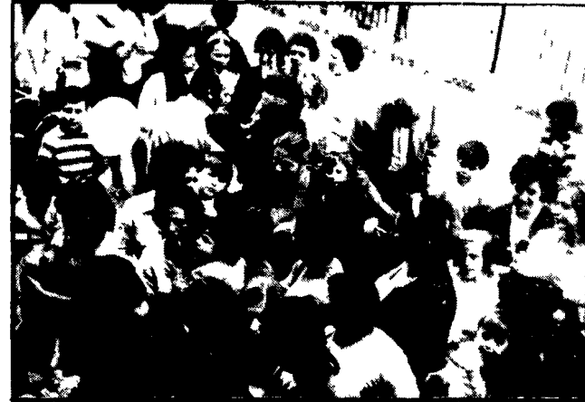
Organizzata dalla FGCR si svolgerà all'Eliseo il 10 ottobre

La scuola è cominciata solo per un quarto degli scolari e degli studenti romani. Ed è cominciata sotto il segno del caos, forse ancor peggio di come si prevedeva: doppi e tripli turni a classi sovraffollate, come era avvio; ma anche tre bambini per banco, cimici in un prefabbricato di cui le poche aule nuove pronte ma mancanti dei banchi e delle attrezzature più elementari. Scuole promesse e non ancora completate (la « Buca » sulla Collatina e la « Fct » in via Aquilonia che dovevano avere altri locali). Insomma il Comune e la Provincia hanno fallito ancora una volta la prova anche per le situazioni più elementari immediate e forse è stata la ragione dei genitori dei ragazzi un po' dappertutto ci sono stati i primi scioperi e i primi cortei e le prime proteste. Il gruppo di lavoro di attività delegazioni che convergono nel per esempio da Nuova Magliana e Massimina) sul Campidoglio martedì prossimo. Un centinaio di madri di bambini che in prima fila i consiglieri comunali e di ricostituzione del Pci i compagni delle sezioni e della Fgcr è stato diffuso in migliaia e migliaia di copie. Un volantino stilato dalla Federazione e dalla Fgcr e popolazione uscite infatti ne hanno discusso i te-