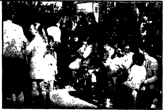
Numerose manifestazioni di protesta si sono svolte ieri per il caos nelle scuole, come alla Magliana (foto a sinistra) e alla borgata Cinquina (foto a destra)

Inizio nel segno della confusione — Lezione solo per un quarto degli scolari e degli studenti romani — Aule nuove ma senza banchi e scuole che dovevano essere pronte e ancora non lo sono — Le cimici in un prefabbricato del Tufello — A Nuova Magliana le madri hanno raccolto le iscrizioni per la materna — Una scuola-fantasma a Romanina il Comune giura che c'è ma non è vero — Proteste ad Aguzzano e a Massimina