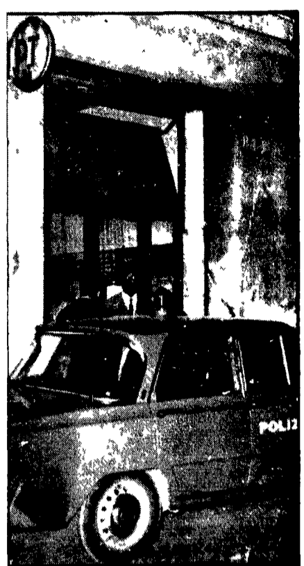
L'ufficio postale di via Luca Tarigo, davanti al quale è avvenuta la rapina a mano armata.

Richiesta del consiglio regionale al governo