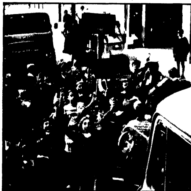
Palermo — Gli scolari del quartiere di Sant'Isidoro bloccano la strada per protesta

Non va nemmeno sottovalutato il fatto che da qualche mese il tribunale di Milano ha ridotto a soli dieci persone personali che viene diviso nella giornata in turni di quattro. Praticamente di personale fisso vi sono solo quattro custodi. Un abbandono completo quindi anche dal punto di vista della vigilanza da parte di un personale ridotto agli estremi e che non sempre è all'altezza del compito data la delicatezza di esso.