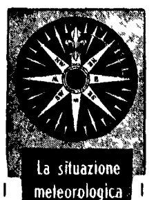
La situazione meteorologica

Con tutta tranquillità e in pieno rispetto della centralissima via della Croce hanno capito che una boutique la Juan Couture caricando su un camion abito p. lince, contorni di altri modelli tutti per un valore di centomila. Per un fatto non è stato Rimi e gli arresti per il reato di aver avuto voce una grossa voce in capitolo nella selvaggia azione di criminalità mafiosa culminata nel feroce regolamento di conto in cui è stato ucciso un magistrato e un procuratore. Genna basate su una documentazione che — al di là degli stessi casi più recenti in cui il Rimi è stato