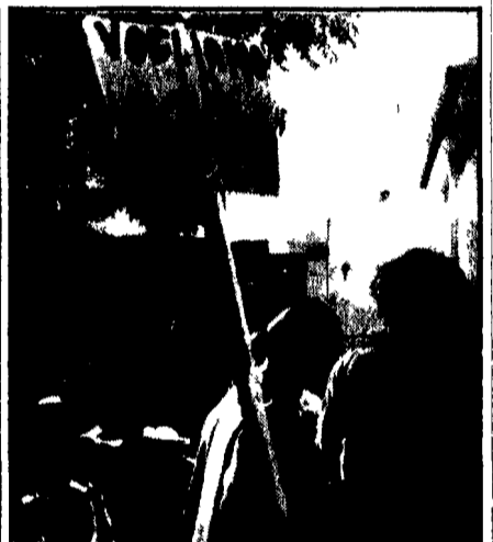
La manifestazione di protesta contro la scuola-caos ieri alla Massimina

La dimostrazione di protesta della scuola manifestando di notte davanti al teatro Eliseo di via Nazionale, il servizio dei trasporti di cui risentono pesantemente anche gli alunni, provocano ogni qualvolta una manifestazione davanti a una delle scuole della città, davanti a una famiglia. La settimana che si chiude ha visto però solitarsi la forte protesta di alunni, genitori e insegnanti contro la scuola-caos, contro la responsabilità del governo e del Comune per un rinnovamento profondo del nostro sistema educativo.