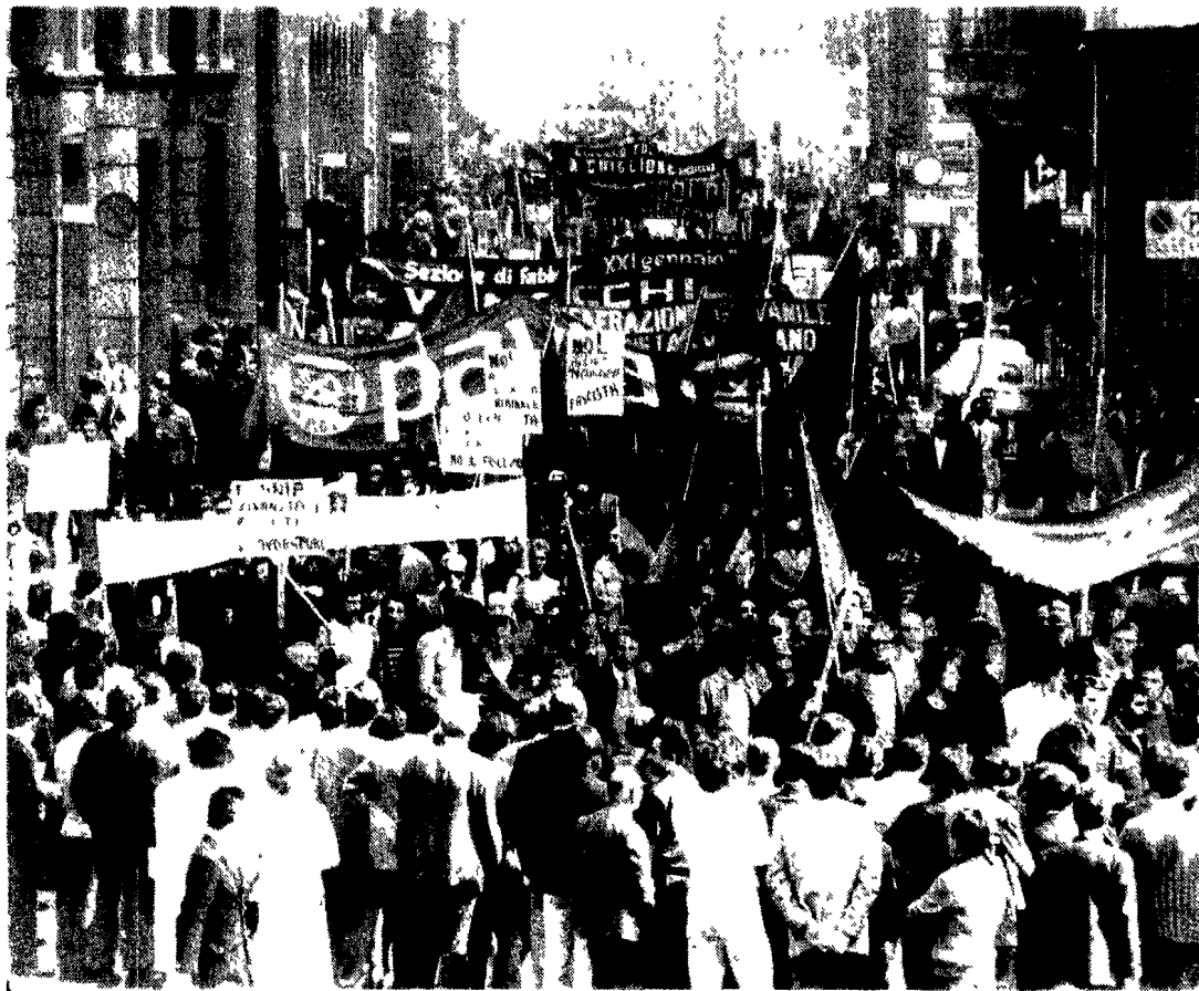
MILANO -- Un aspetto dell'imponente corteo antifascista mentre sta per giungere in piazza Duomo

MILANO ha vissuto una grande giornata democratica antifascista un corteo spontaneo di un milione di cittadini in un giorno di grande partecipazione. Il giorno di festa non ha calcolato l'ingombrante con una forza politica non di facile presa. I comunisti non si sono lasciati ingannare dalla tattica di un partito che si è dato l'obiettivo di sommare il suo nome all'antifascismo e lusingando nell'isolamento la celebrità della città di Milano.