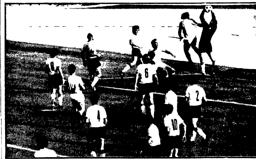
LAZIO NOVARA 5-2. Una fase del match con ben nove piemontesi asserragliati in area

CHARLOTTE, 11. La Romania non ce l'ha fatta. E gli Stati Uniti per il terzo anno consecutivo si sono aggiudicati l'insediato d'argento superando i romeni nella finalissima di Coppa Davis. Dopo che sabato il punteggio si era chiuso sul 2-1, in favore degli USA, oggi, con la vittoria di Smith su Tiriac, si è decretato il definitivo successo degli americani. L'ultimo singolare ha visto il successo del romeno Na stase sull'americano Froehling, il che ha permesso ai romeni di accorciare le distanze, ed uscire battuti con onore dalla finale 3-2. Nessuno però può contestare che i vari Spinosi, Causio, Betegua, Bet Santarini, Salza, Capello non siano elementi di indubbio valore. Nessuno ha mai chiesto a Valcareggi di sostituire in blocco la nazionale maggiore con la «Under 23» ma di procedere a doverosi rinnovi e crepe preoccupanti in prospettiva di Monaco 74. E in conto di Roma del 20 novembre è riuscito in preventivo. Non si può parlare di crisi per questo scopo.