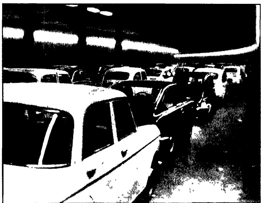
Nella foto: il sottov a corso d'Italia bloccato dal traffico

Anche qui sono in corso i lavori per il metrò e i tecnici della SAOP hanno « coperto » accanto alla galleria percorsi della « talpa » delle antiche casse di porzellanella decine di metri: si sono accorti che stavano cominciando a franare ed hanno dato l'allarme. Lo « scudo » sarebbe ovviamente inaccettabile.