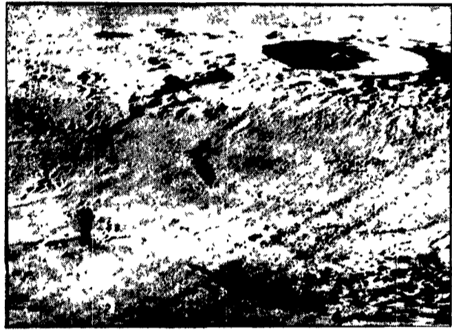
Questa è un'immagine della superficie lunare trasmessa dalla stazione automatica sonda Luna 19, in orbita attorno al satellite. La foto è stata scattata da un'altezza di 130 chilometri