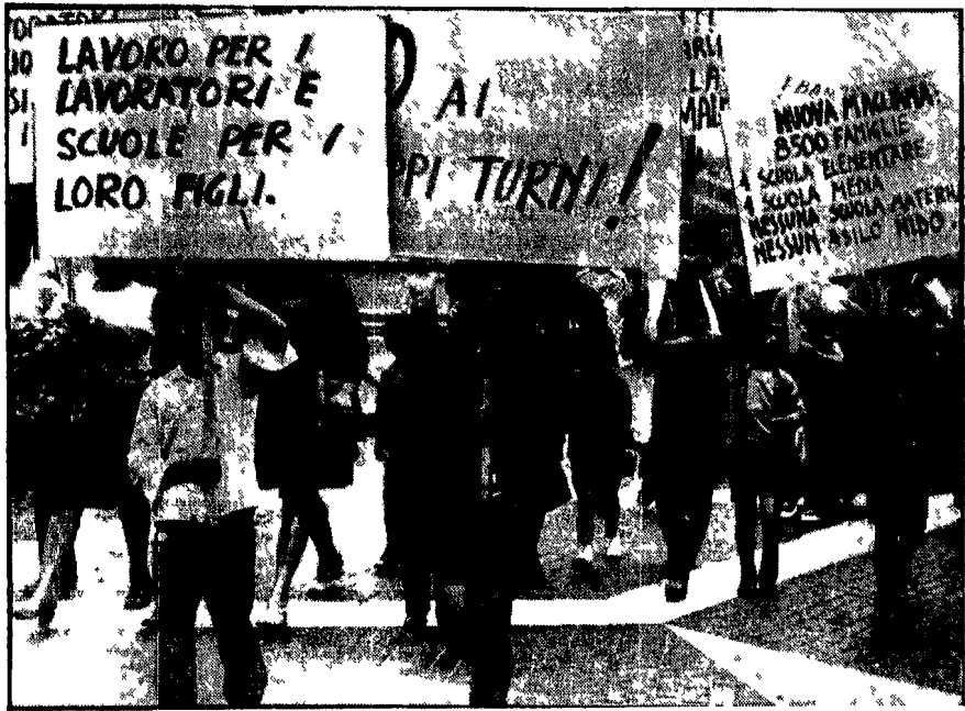
Una recente manifestazione popolare in Campidoglio la situazione scolastica a Roma è drammatica