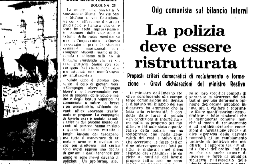
BOLOGNA - Un momento della manifestazione e studentesca contro la repressione

«Prendiamo ancora il tipo di tolleranza burocratica», questa è la sostanza del discorso pronunciato ieri alla Camera dal presidente della Regione emiliana Lucifreddi.