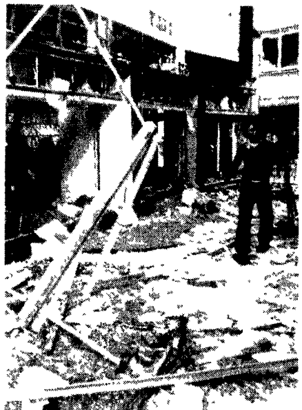
BELFAST - Le macerie di un negozio nel centro di Belfast distrutto sabato dall'esplosione di una bomba