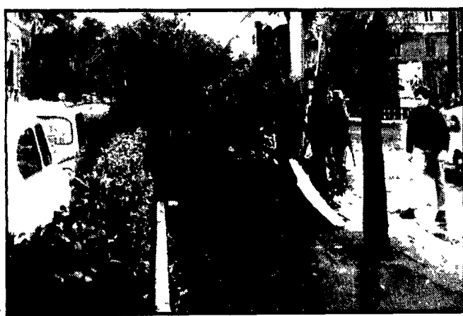
Le raffiche di vento hanno fatto strage di alberi anche ieri, un'ulteriore difficoltà per il traffico già notevolmente congestionato

Numerose casupole sono state anche scoperciate: i massi che « reggevano » un tetto si abbattono su un giovane malato di cuore - Sradicati dal vento alberi e cartelloni pubblicitari - Palo dell'alta tensione si abbatte sulla strada, a Tor Carbone - Senza luce numerose zone - A Fiumicino soppressi alcuni « voli »