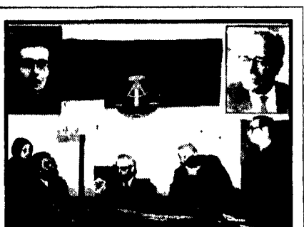
Incontro a Villa Gordiani con i compagni della RDT

Nessuno muove un dito in Campidoglio per arginare l'aumento dei prezzi - Come viene attuato il controllo: 120 ispettori per 60.000 punti di vendita - Utilizzare l'Ente comunale di consumo per frenare la speculazione