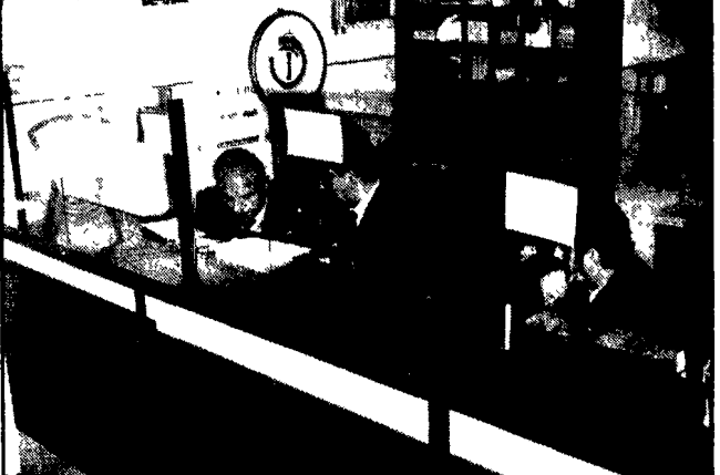
L'ufficio postale rapinato a Casal Morena; nella cassaforte (ma i rapinatori non ci hanno pensato) c'erano alcuni milioni in contanti

Nel locale c'erano i tre impiegati e dodici clienti quando sono entrati due giovani - Uno ha puntato il coltello alla gola di un dipendente e si è rivolto alla direttrice - Hanno « dimenticato » la cassaforte: dentro c'erano molti milioni - Fuggiti con 2 vetture