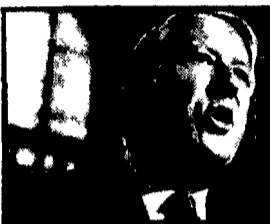
Heath, capo del governo conservatore