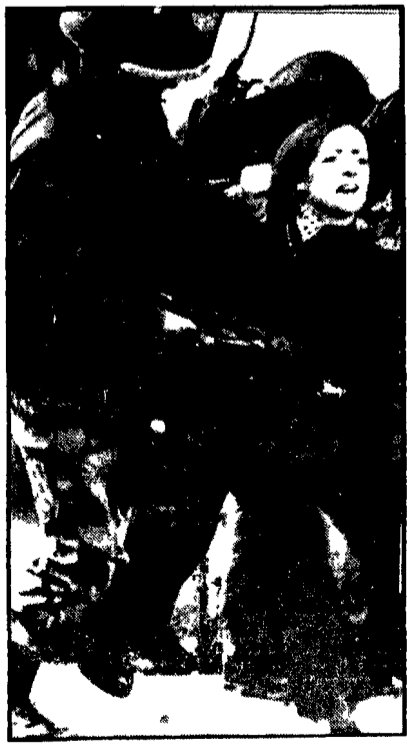
ANTONIO BRONDA - Una ragazza vittima di uno dei tanti episodi di brutale repressione da parte delle truppe inglesi