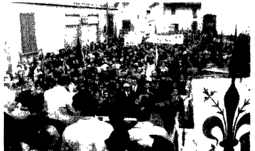
Imponenti manifestazioni antifasciste ieri in numerose città. Nella foto a sinistra un aspetto di Piazza Castello a Torino affollata da migliaia di cittadini; a destra il raduno popolare nel rione delle Panche a Firenze durante la rievocazione dell'eroica giornata del primo marzo 1921